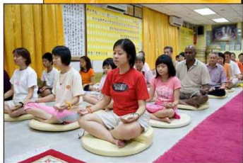
■「天与地的法则」其实是一种自然力量法则，Telamaha 希望通过静坐修灵来让大家了解这法则的力量。