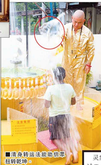
■清身转运法能助信眾扭转乾坤。