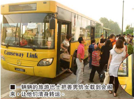
■一辆辆的旅游巴士把善男信女载到会阁来，让他们清身转运。